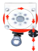
Linkeroller (Getriebe außen)