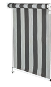
Stoff hinter der Welle abrollend