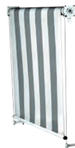
Stoff vor der Welle abrollend (Standard)