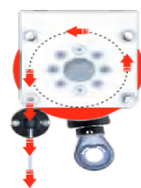
Rechtsroller (Getriebe innen)